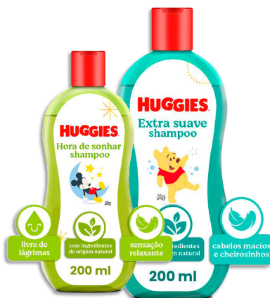
SHAMPOO E CONDICIONADOR PARA BÊBES