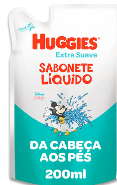
SABONETE LÍQUIDO PARA BÊBES