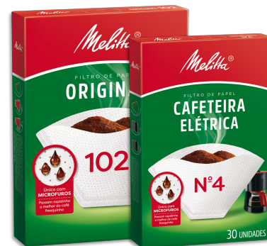
FILTRO DE PAPEL