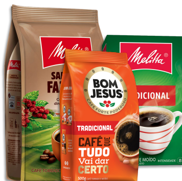
CAFÉ TORRADO E MOÍDO