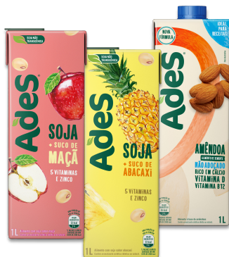
BEBIDA PRONTA A BASE DE SOJA