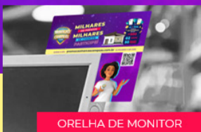
ORELHA DE MONITOR